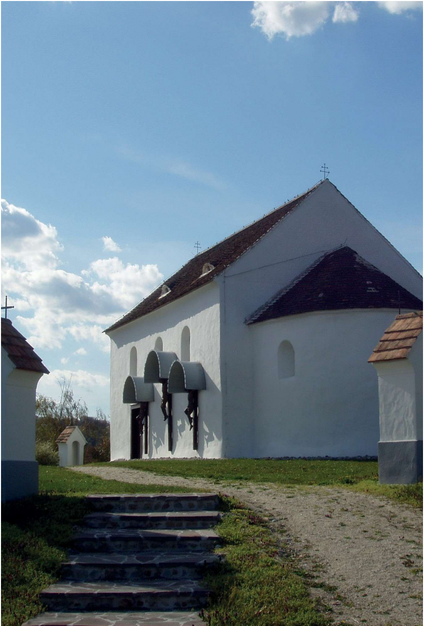
Die Bergkirche in Stoob.