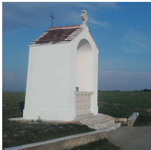
Kapelle in Müllendorf. Das Burgenland ist reich an Klein- und Kleinstdenkmälern, die es zu erhalten gilt.

Restaurierungen und Renovierungen von Objekten dürfen niemals eigenmächtig durchgeführt werden. Um bestmöglichen Schutz und langfristige Werterhaltung zu gewährleisten, ist die Beauftragung von Fachleuten im Umgang mit sensiblen Materialien alternativlos!