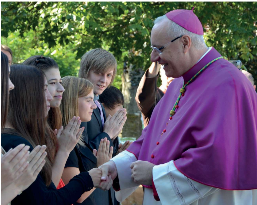
Diözesanbischof Ägidius J. Zsifkovics bei der Visitation in Markt St. Martin.

Das garantiert eine gerechte Verteilung der Zuschüsse durch die Finanzabteilung, sowie die regelmäßige Überprüfung der kirchlichen Objekte durch die diözesane Bauabteilung.