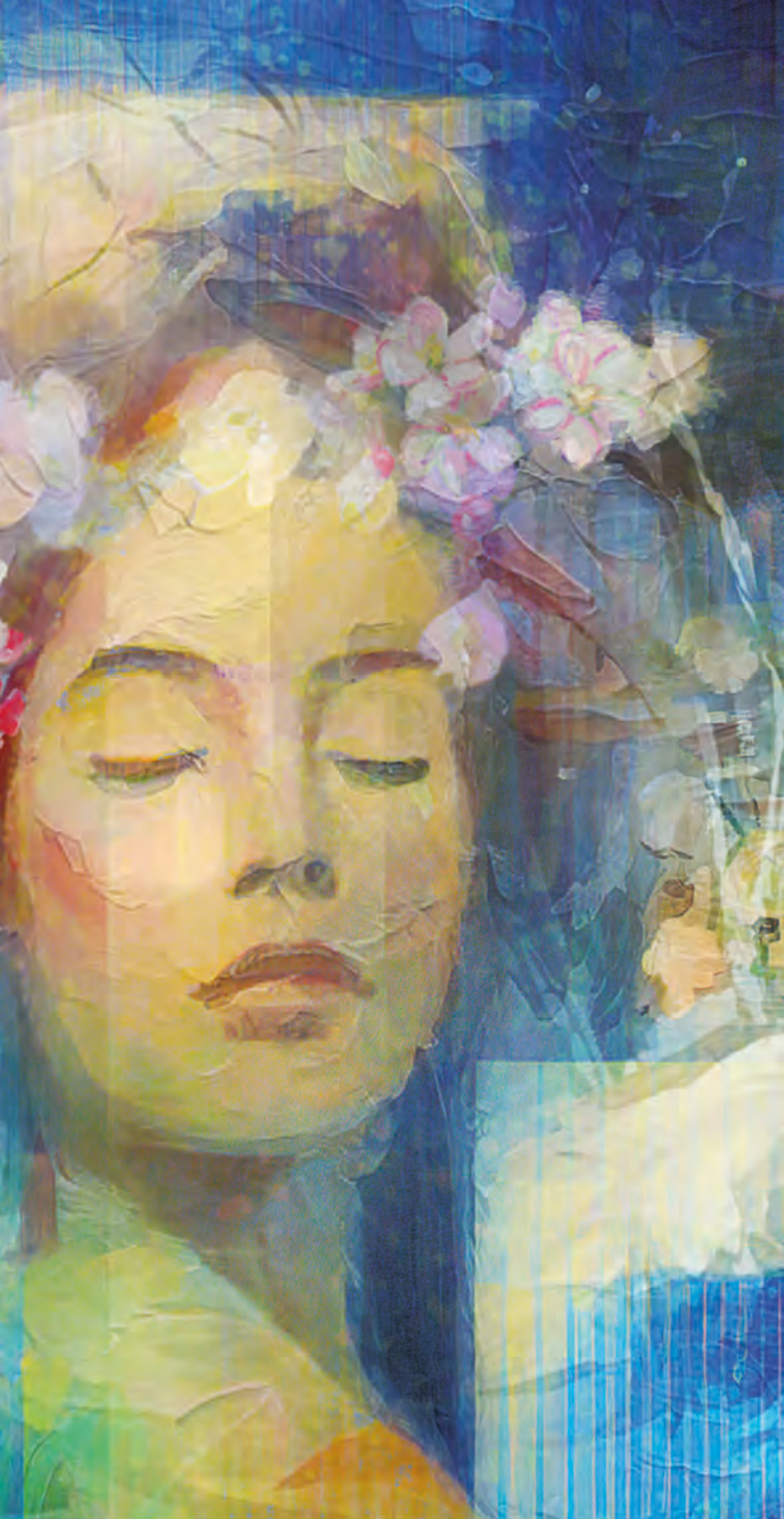
Evas Wintertraum vom blühenden Apfelbaum, KI-generiertes Bild, Heinz Ebner, 2023 – Ausschnitt