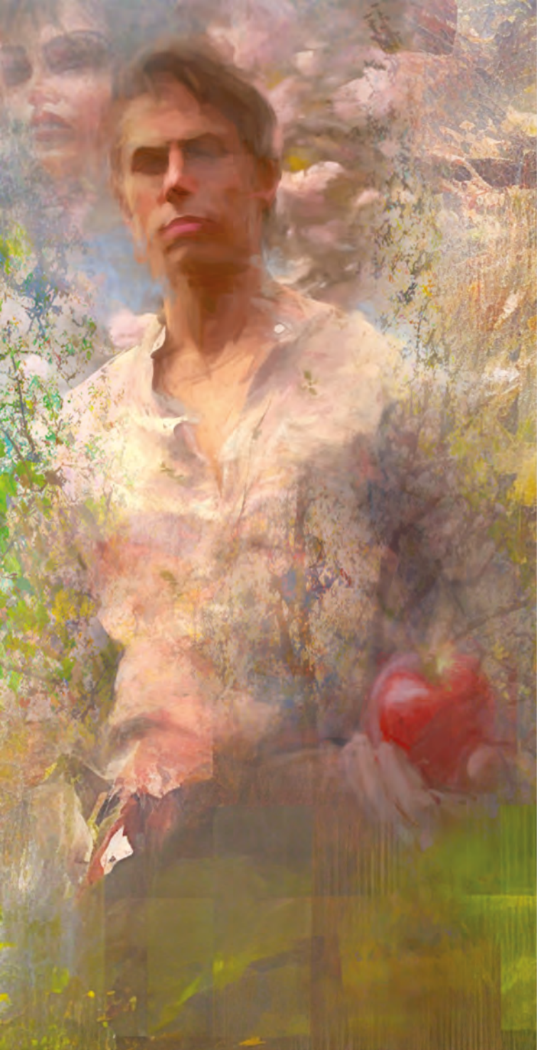
AdamsFrühlingstraum von Eva, KI-generiertes Bild, Heinz Ebner, 2023 – Ausschnitt