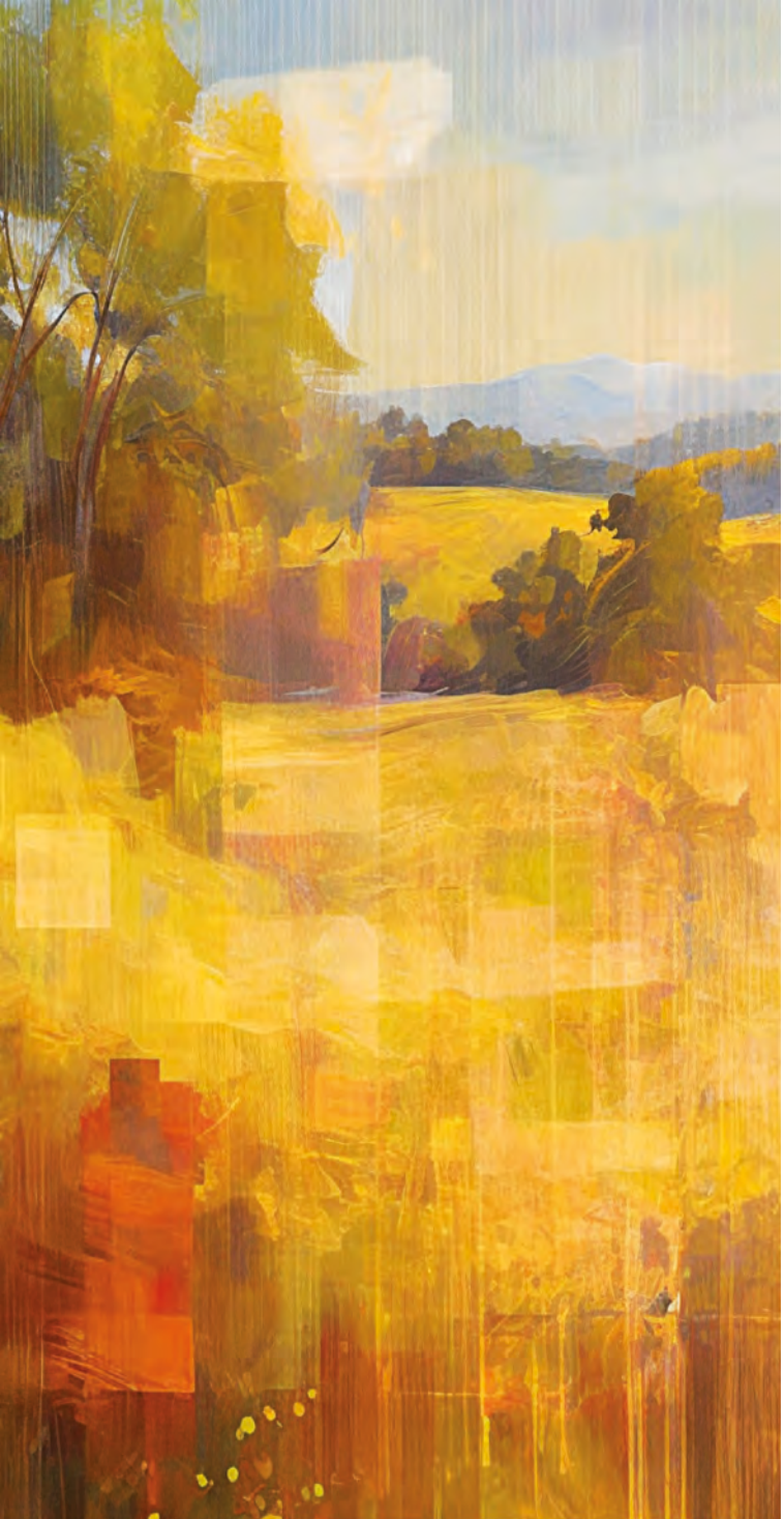
Sommer-Paradies, KI-generiertes Bild, Heinz Ebner, 2023