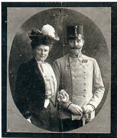
Erzherzog-Thronfolger Franz Ferdinand und Gemahlin Herzogin Sophie von Hohenberg gefallen durch Mörderhand am 28. Juni 1914 in Sarajevo.