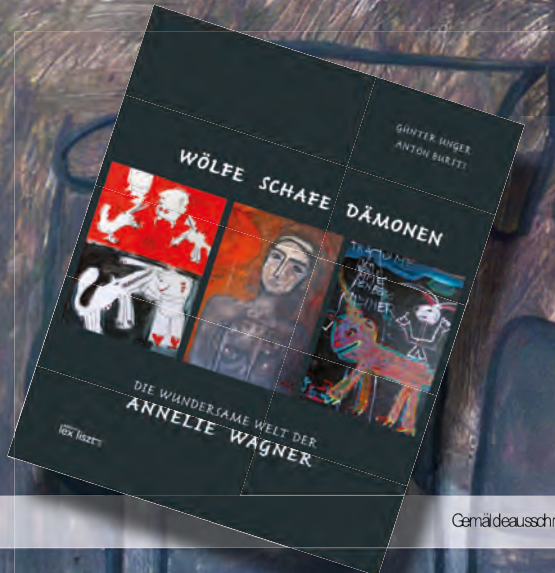
Gemäldeausschnitt und Buchtitelseite