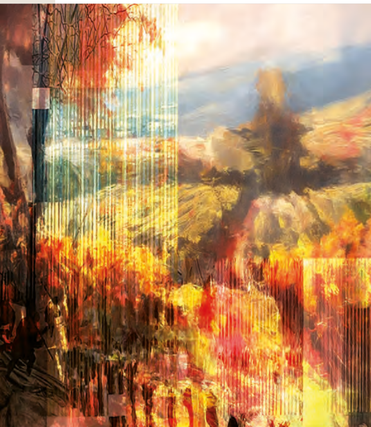
Herbst-Paradies, KI-generiertes Bild, Heinz Ebner, 2023

Veranstalter: Pastorale Dienste (Kategoriale Seelsorge/Gehörlosenseelsorge)